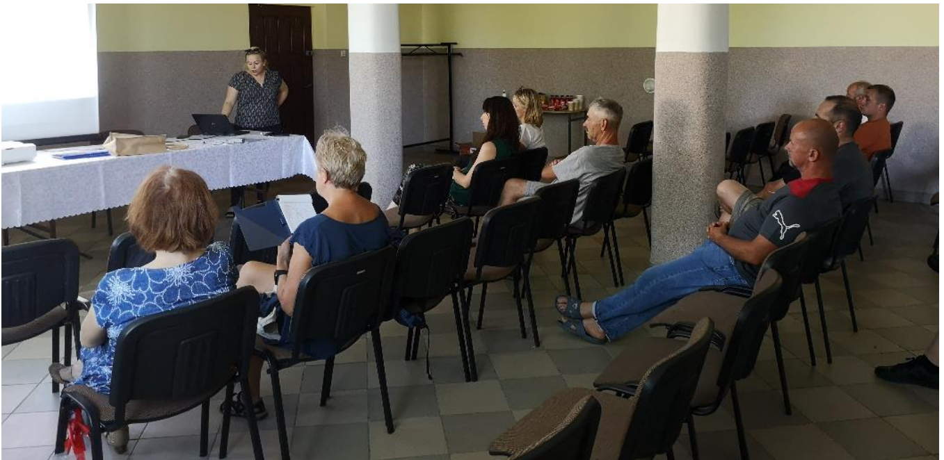
Zdjęcie 1. Spotkanie otwarte w Tykocinie.